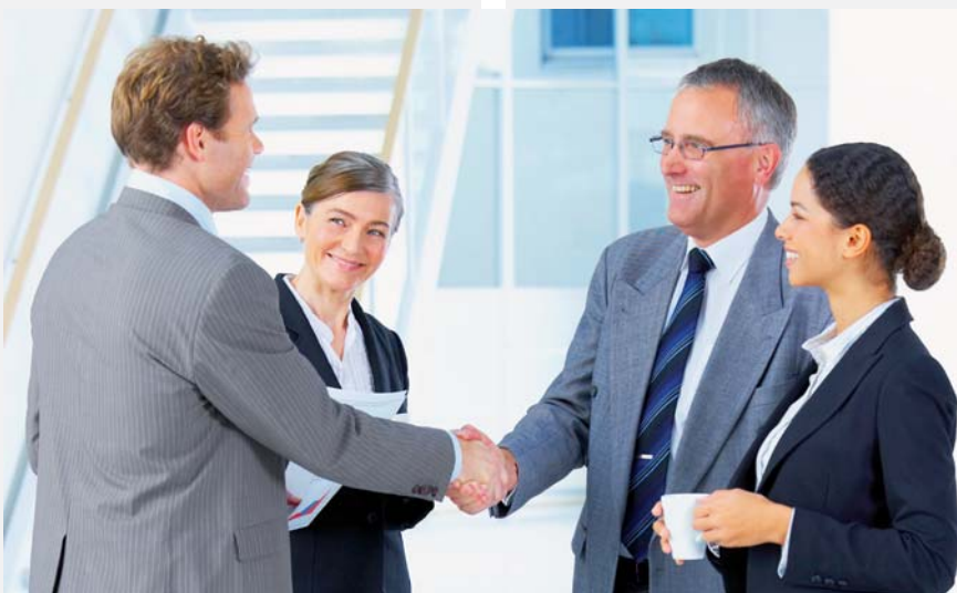
Personal-Recruiter von PLUS Care People informieren in Schulen und bei Weiterbildungsträgern über berufliche Chancen und Möglichkeiten